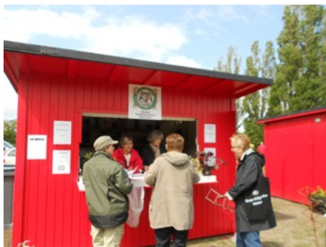
Från Malmö Garden Show