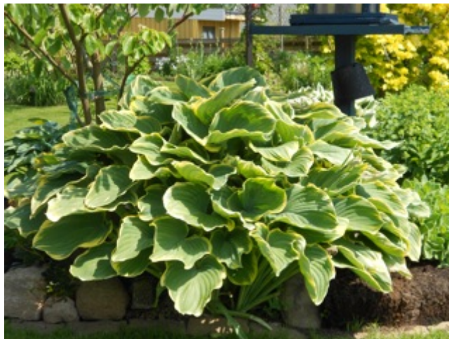
Hosta i Holmeja

Önska får man.... så jag önskar är att många vill bjuda in till sina trädgårdar och ha Öppen Trädgård 2012.